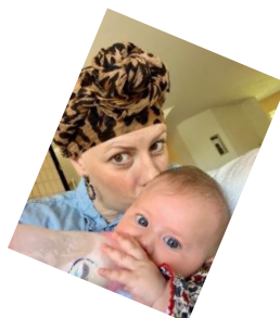
Dadju – Reine