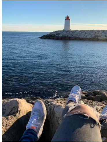
L'image que tu choissais pour te ressourcer